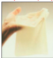
Obr. č. 1 Dentální rouška (koferdam)

Riziko: riziko přenosu infekce HIV a ostatních sexuálně přenosných infekcí není při orálním styku tak vysoké jako při nechráněné anální či vaginální souloži. Ani toto riziko ovšem není zcela zanedbatelné, zejména pokud má partnerka projevy některé sexuální infekce na rtech či v ústech (může se jednat např. o syfilitický vředelek). Nežádejte nikdy provedení felace bez kondomu. Při této sexuální praktice raději rovněž použijte kondom.